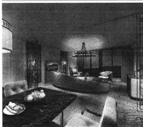
サンクチュアリコート高山は滞在自体を楽しむつらえだ(客室のイメージ)

9カ月連続で350万円を超えた。コロナ前の18〜19年は250万円前後で推移していたが、コロナ下で値上がりし、高価格帯を維持している。特に5月は100万円未満の低価格帯の会員権の取引数が全体の41%と、4月から7割上昇したのが特徴だ。4月末、5月上旬のゴルフデンウィークの大型連休は、3年ぶりにコロナ対策の行動制限がなかった。海外旅行が難しい中、リゾートホテルなどを利用した人も増加したという。こういったリゾート施設の快適さを知ったことで、頻繁に利用できる会員権の購入に関心を持ったようだ。